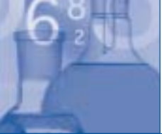
T A B 6